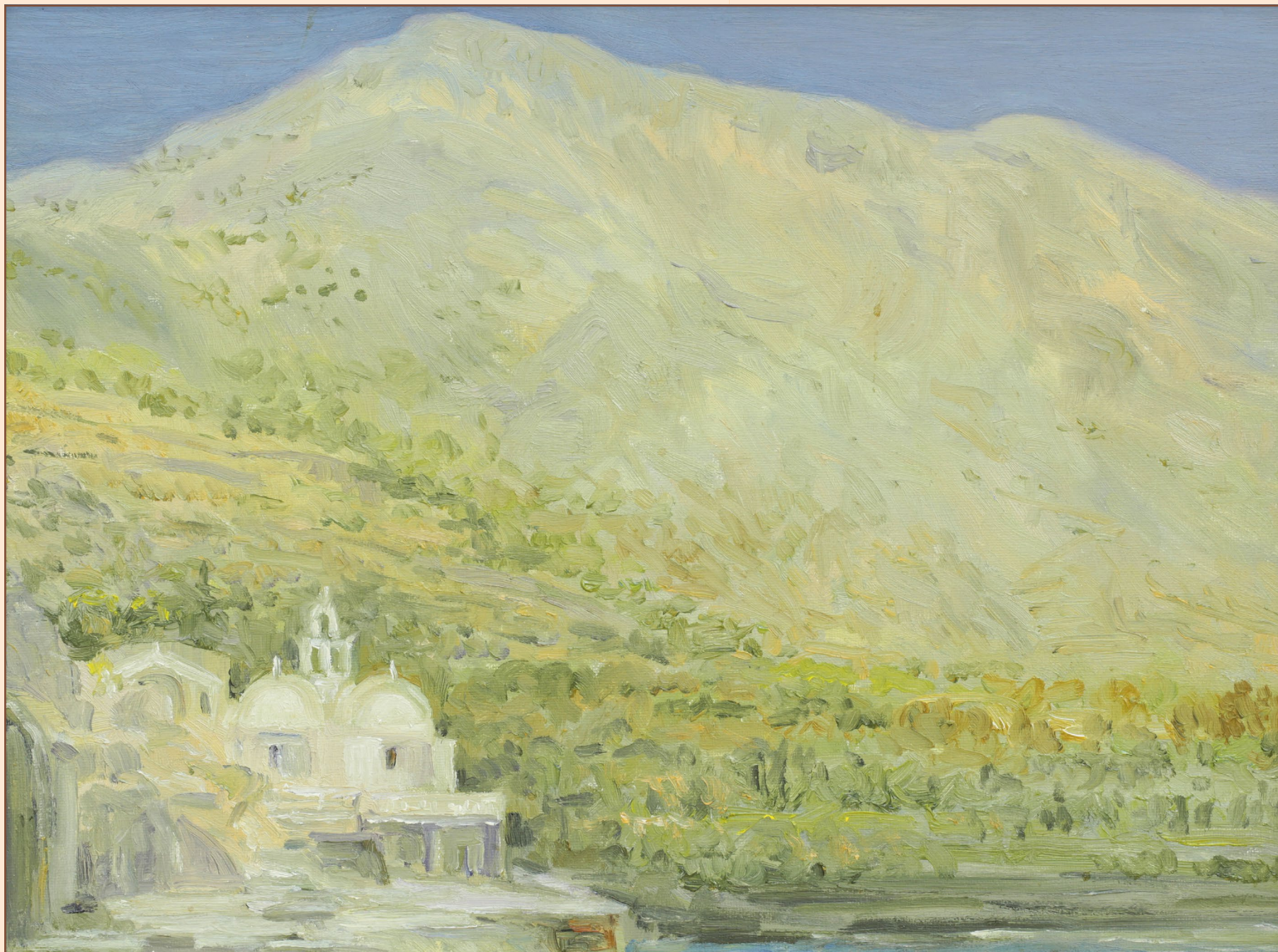
9. Пейзаж Камари о. Сантарини Греция, 2013 Холст, масло 30 x 40 см