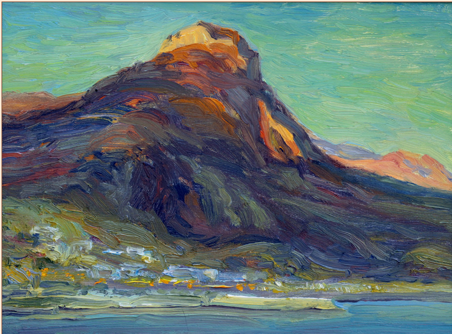
2. Вигла Крит, 2012 Холст, масло 18 x 24 см