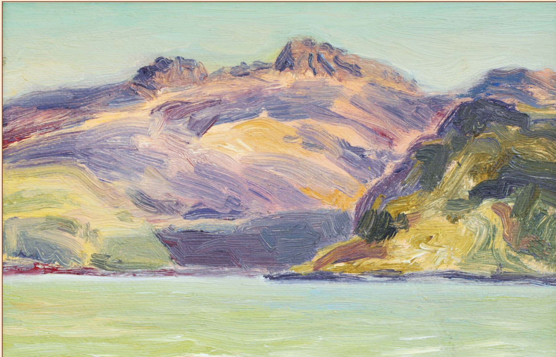
1. Крит, 2012 Холст, масло 13 x 18 см