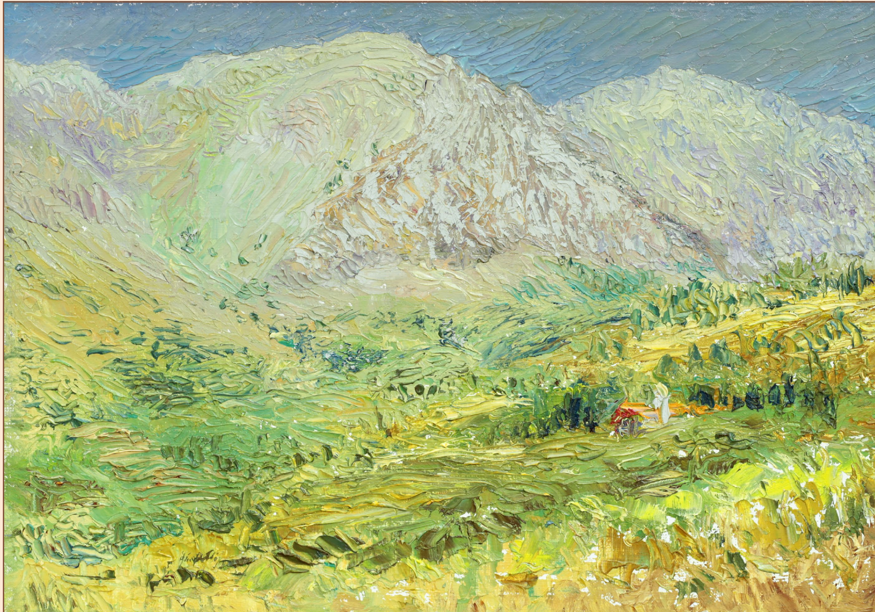
8. Гора Парнассос Греция, 2015 Холст, масло 25 x 35 см