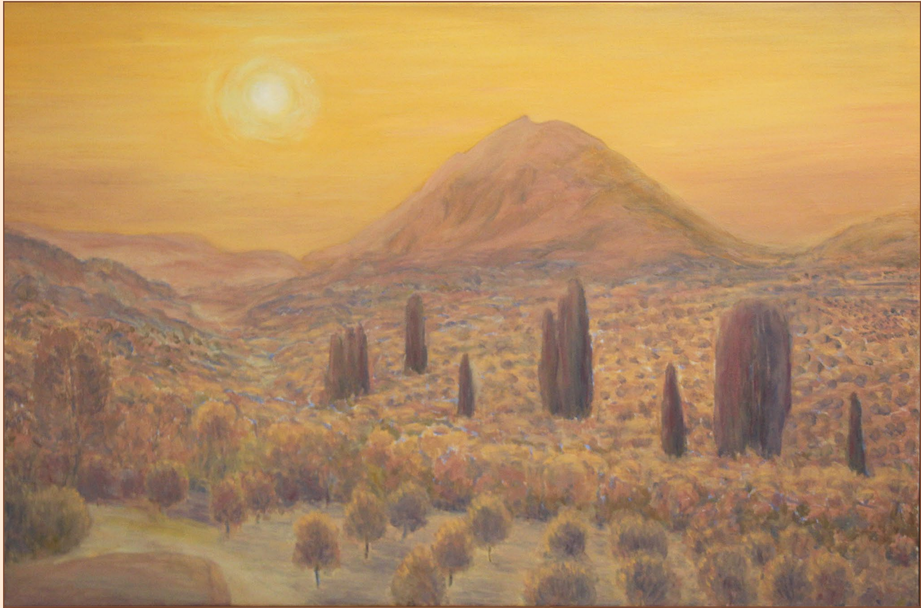
12. Пейзаж со священной горы Юхтас, 2016 Холст, масло 90 x 60 см