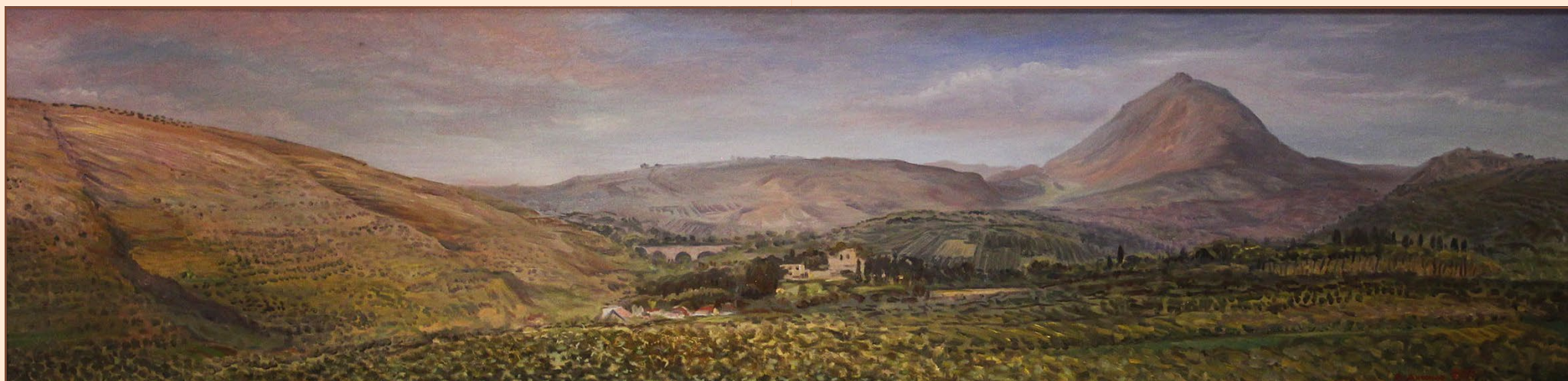
15. Крит. Вид на св. гору Юхтас, 2005 Холст, масло 180 x 48 см