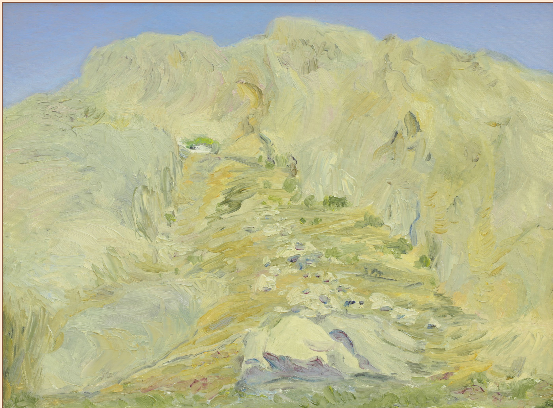
10. Пейзаж о. Сантарини Греция, 2013 Холст, масло 30 x 40 см