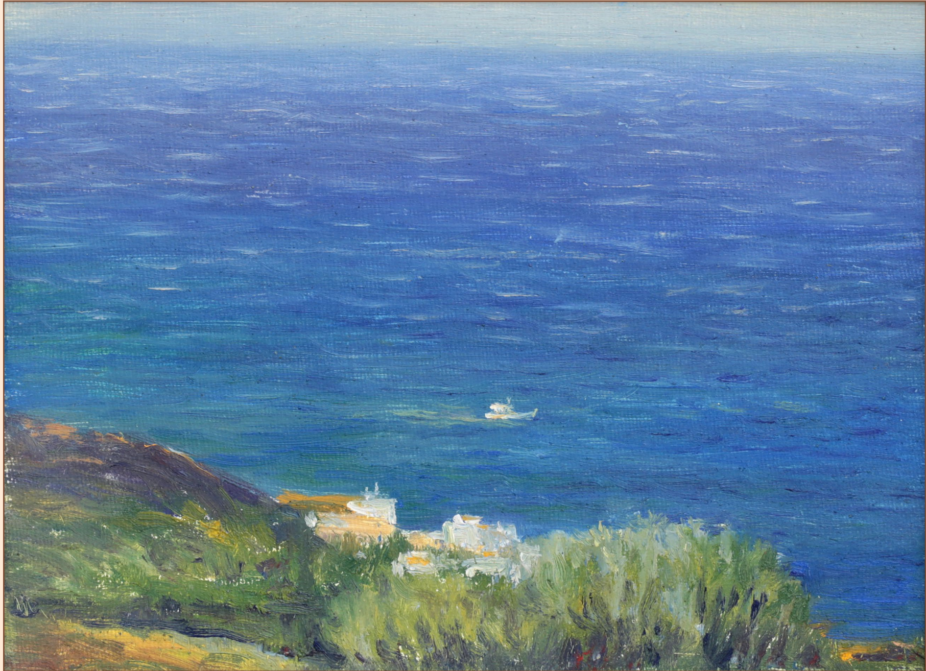
5. Этюд Ливийское море Крит, 2012 Холст, масло 18 x 24 см