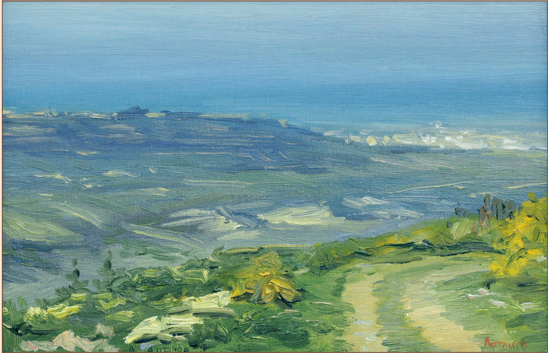
7. Этюд, 2006 Холст, масло 20 x 30 см