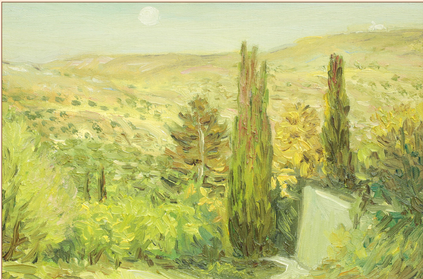
11. Греческий мотив Крит, 2006 Холст, масло 20 x 30 см