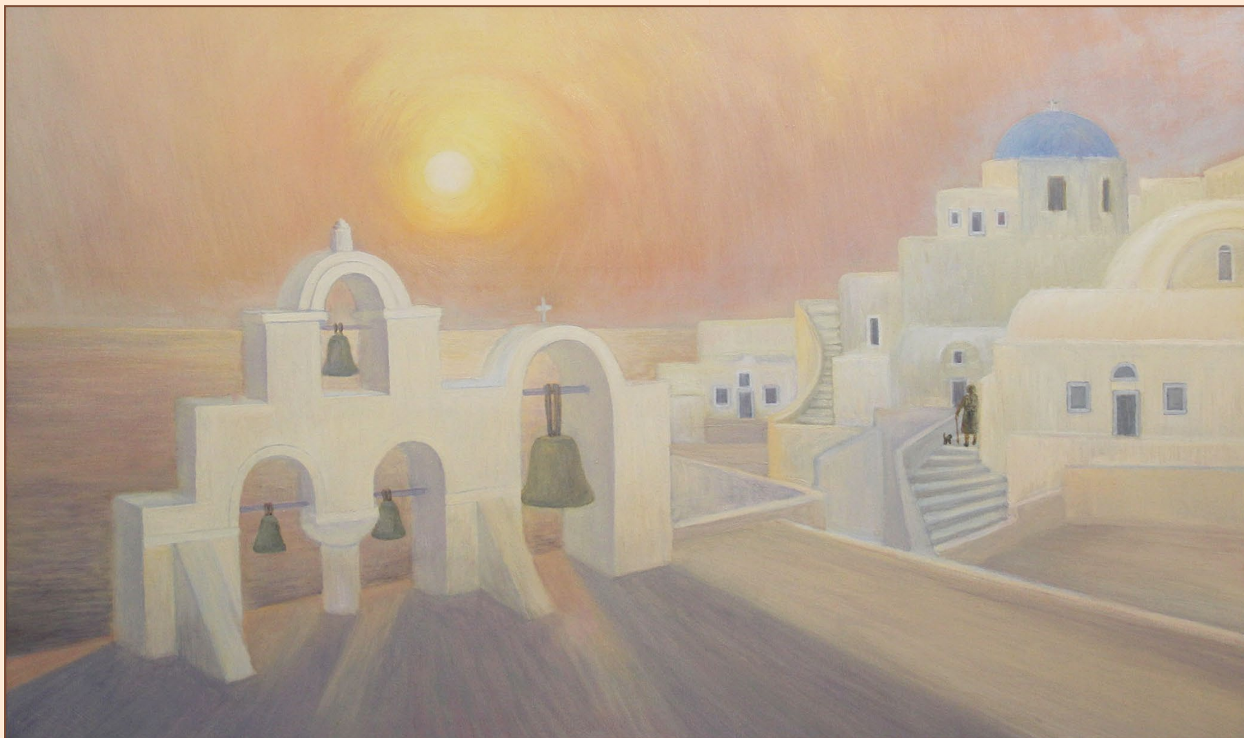
13. о. Санторини, 2015 Холст, масло 90 x 60 см