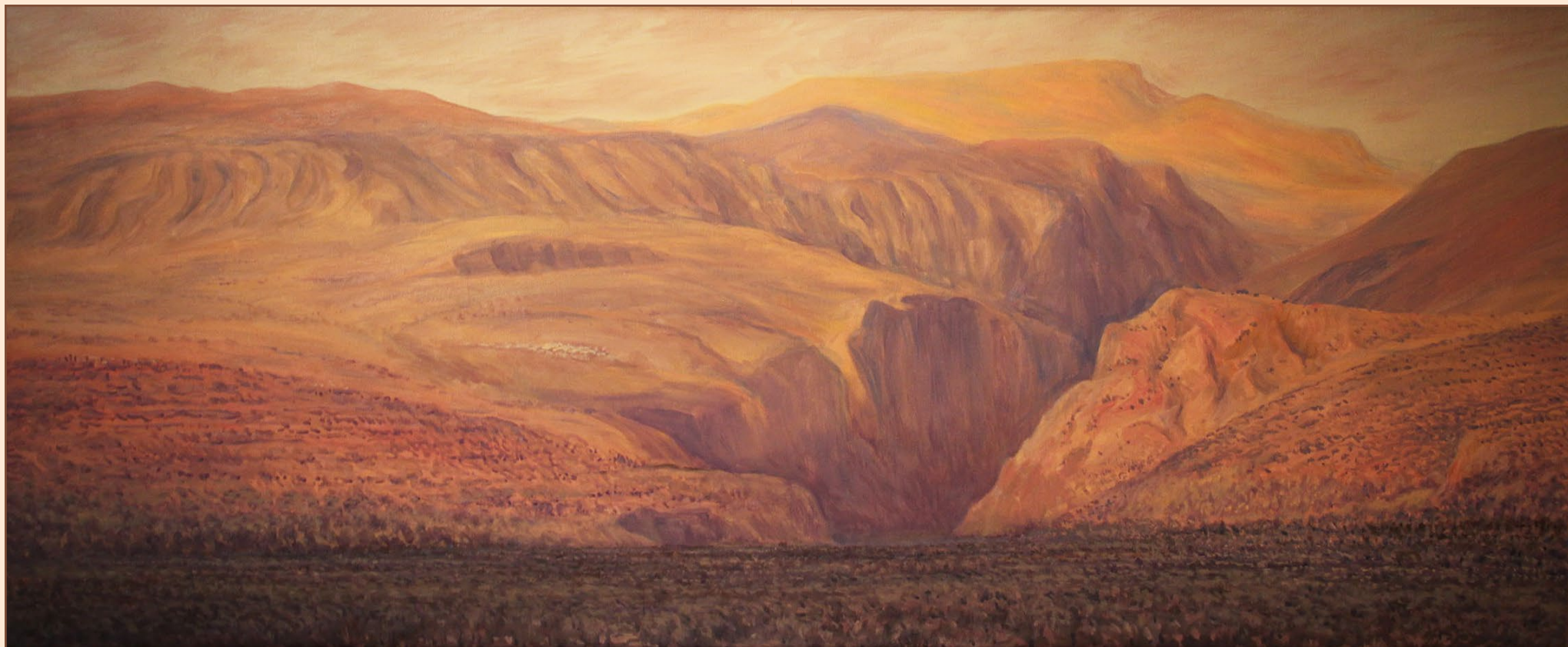
14. Дельфы и св. гора Парнассос, 2016 Холст, масло 120 x 50 см