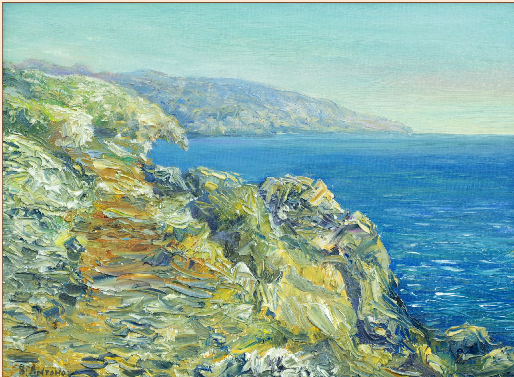
6. Берег южного моря, 2006 Холст, масло 30 x 40 см