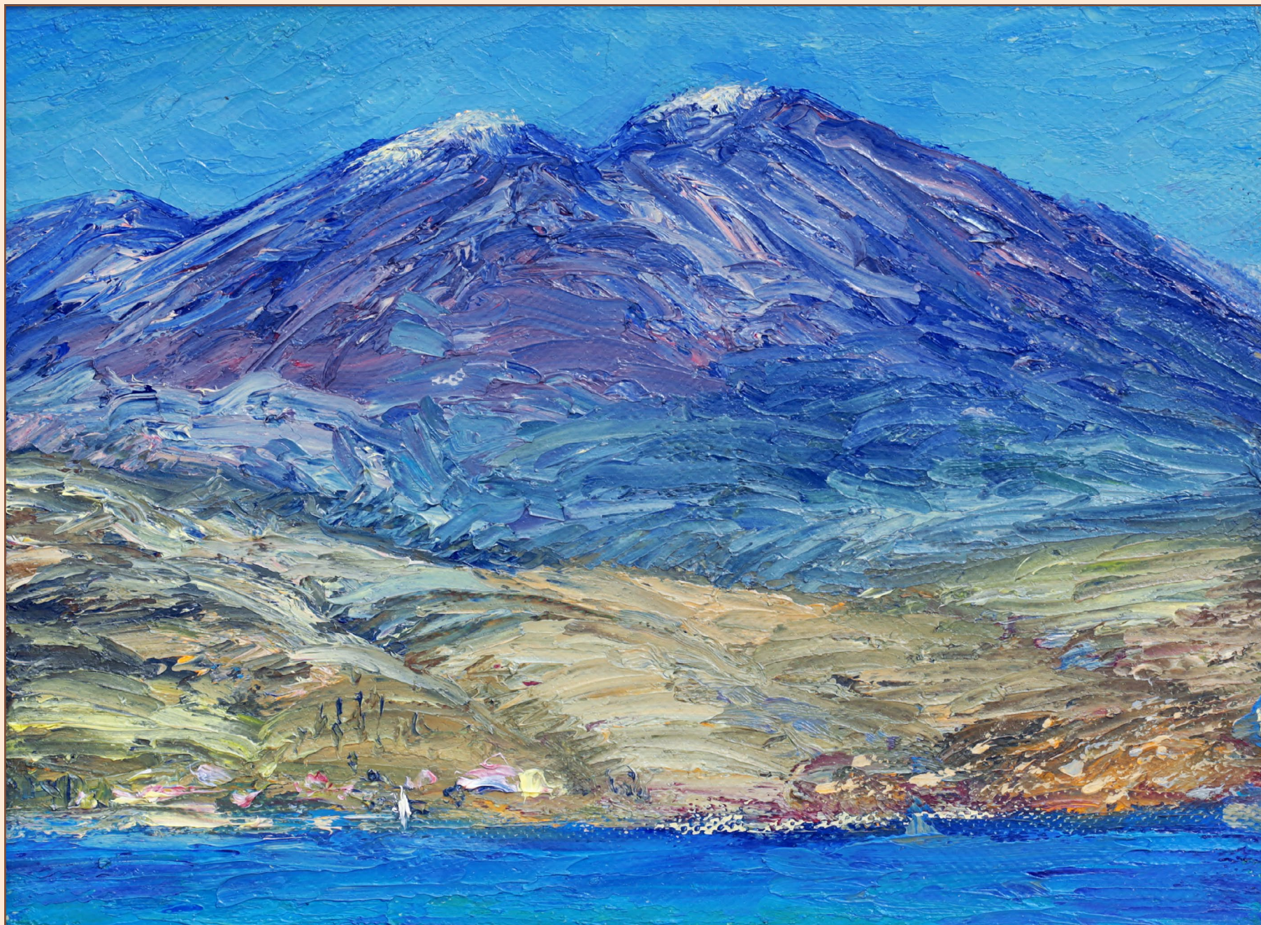
3. Гора Иона, 2015 Холст, масло 18 x 24 см